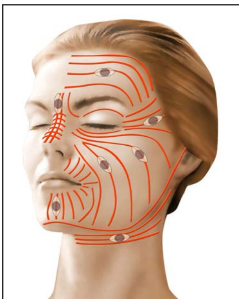
lignes de moindre tension de la face - orientation optimale des fuseaux d'excision

Souvent, il est nécessaire d'avoir recours à un tracé d'incision spécial visant à « briser » l'axe principal de la cicatrice initiale, à réorienter au mieux la cicatrice en fonction des lignes de tension naturelles de la peau, et à diminuer ainsi la tension exercée sur les berges de la plaie.